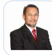
Esa Bin Ahmad Ketua Pengarah Jabatan Landskap Negara

Peperiksaan Perkhidmatan Landskap (PPL) merupakan salah satu syarat wajib lulus bagi semua pegawai skim perkhidmatan Penolong Arkitek Landskap Gred J29 dan Juruteknik Gred J17 sebelum pegawai disahkan dalam perkhidmatan. Sehubungan itu, Buku Sukatan Peperiksaan Perkhidmatan (PPL) ini diterbitkan sebagai panduan kepada semua pegawai sebelum menduduki peperiksaan tersebut. Saya selaku Ketua Perkhidmatan Landskap berharap agar penerbitan buku ini dapat memberi manfaat kepada pegawai baru sebagai persediaan sebelum menduduki peperiksaan ini.